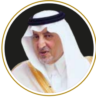
صاحب السمو الملكي الأمير خالد الفيصل بن عبد العزيز آل سعود أمير منطقة مكة المكرمة