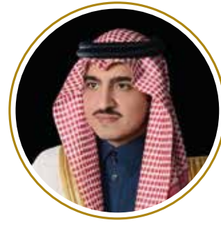
صاحب السمو الملكي الأمير بدر بن سلطان بن عبد العزيز آل سعود نائب أمير منطقة مكة المكرمة