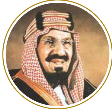
مؤسس المملكة العربية السعودية الملك عبد العزيز آل سعود