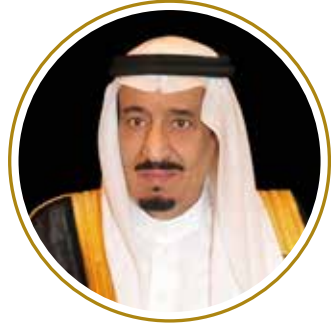
خادم الحرمين الشريفين الملك سلمان بن عبد العزيز آل سعود ملك المملكة العربية السعودية