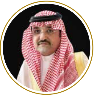
صاحب السمو الملكي الأمير مشعل بن ماجد بن عبد العزيز آل سعود محافظ مدينة جدة