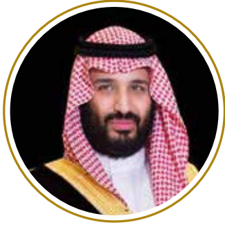
صاحب السمو الملكي الأمير محمد بن سلمان آل سعود ولي العهد نائب رئيس مجلس الوزراء